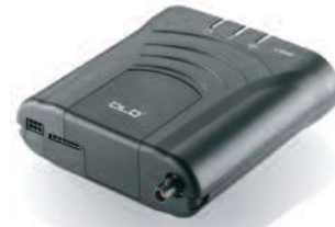
DLD® version Wi-Fi