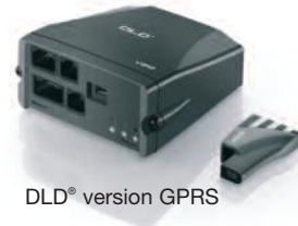
DLD® version GPRS